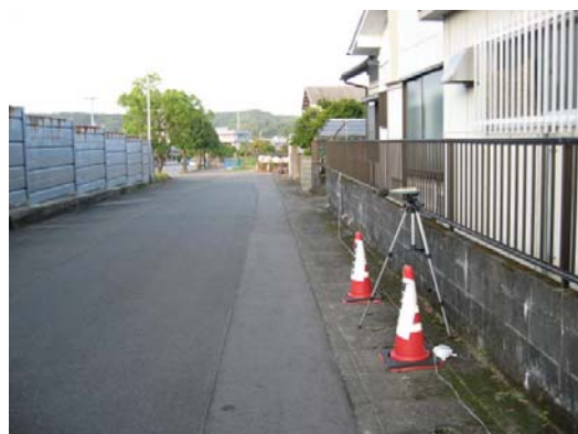
地点②遮音壁背後の測定