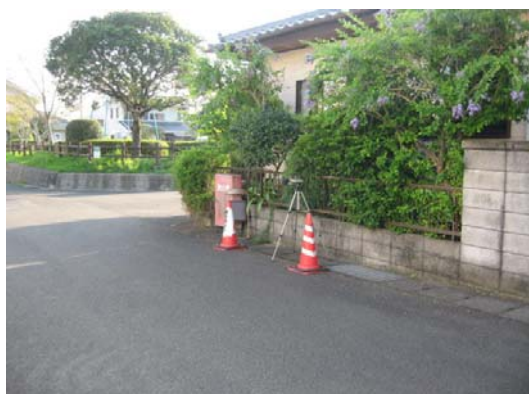
地点①第一種低層住居専用地域での測定