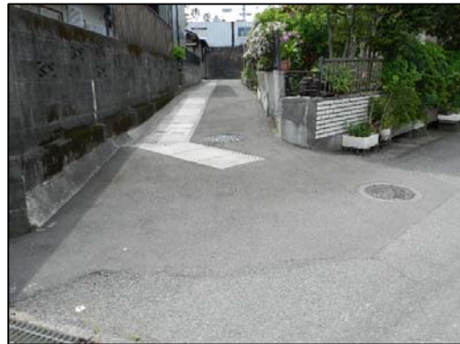
側溝設置による排水経路変更