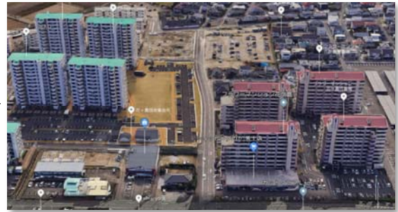
【 完 成 】