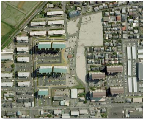
【 施工前 】