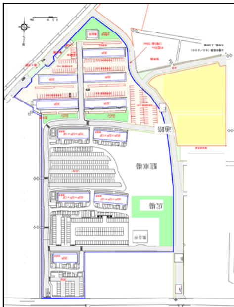
【 建築課計画 】